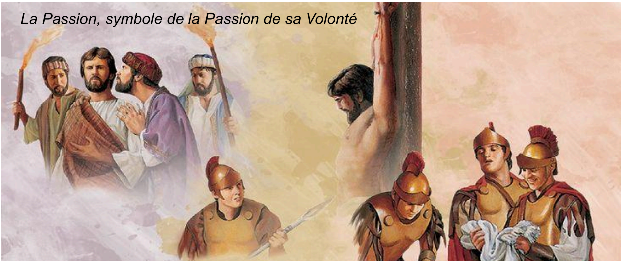
La Passion, symbole de la Passion de sa Volonté

«Tu vois par conséquent qu'en chaque Parole que J'ai dite et en chaque Miracle que J'ai opéré, J'ai appelé ma Volonté à régner au milieu des créatures et que Je les ai appelées à vivre dans mon Fiat. De la Vie publique, Je Suis passé à la Passion, symbole de la Passion de ma Volonté qui durant tant de siècles avait souffert de toutes ces volontés rebelles des créatures qui, en refusant de se soumettre à ma Volonté, avaient fermé le Ciel, brisé les Communications avec leur Créateur ; et elles étaient devenues les esclaves malheureuses de l'ennemi infernal»